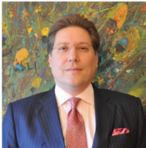
Attorney at law,